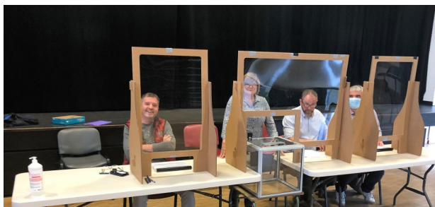
Quelques minutes avant l'ouverture du bureau pour le deuxième tour des présidentielles

Les élus ne sont pas en reste. Si l'on a pu lire dans la presse que dans certaines communes on manquait d'assesseurs pour tenir les bureaux, ce n'est pas le cas chez nous. Tant pour la préparation des bureaux que pour leur tenue dans les règles tout au long de la journée, les volontaires ne manquent pas. Merci à tous.