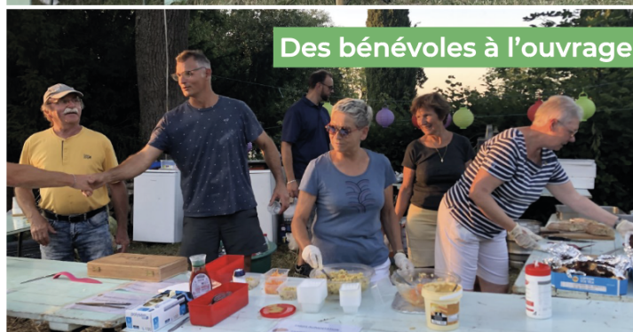
Des bénévoles à l'ouvrage