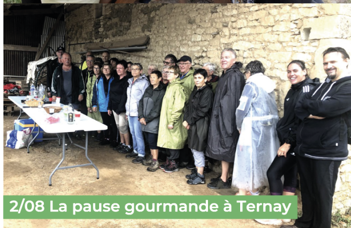
2/08 La pause gourmande à Ternay