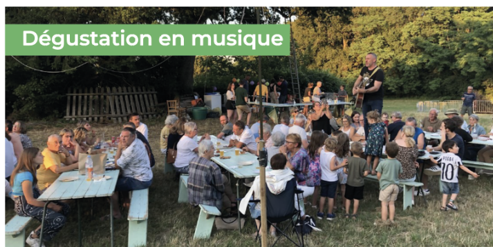
Dégustation en musique

Le 24 juin, le Comité des Fêtes avait donné rendez-vous à Prinçay pour le traditionnel feu de Saint-Jean. Depuis tôt le matin, les bénévoles s'étaient retroussés les manches pour mettre en place tables, bancs, stand, sonorisation, ... et préparer le feu et la sécurité qui l'entourait. En fin de soirée, les Avallais étaient au rendez-vous pour profiter de la musique et du ravitaillement que les bénévoles, encore eux, s'activaient à distribuer. La nuit venue, pour le plaisir des enfants, une balade aux lampions dans les chemins environnants s'acheva par l'allumage du feu. Une belle soirée conviviale dont il faut remercier les membres du Comité des Fêtes qui l'ont permise.