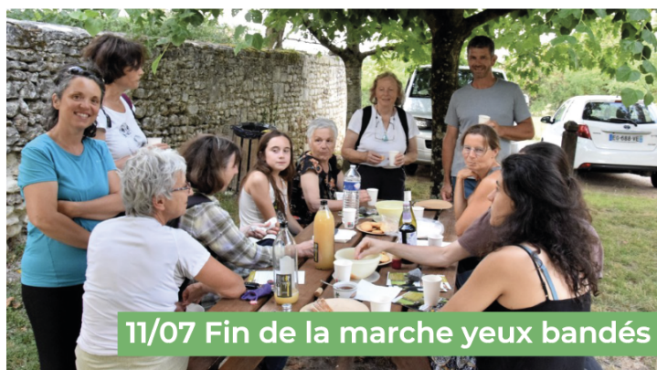
11/07 Fin de la marche yeux bandés